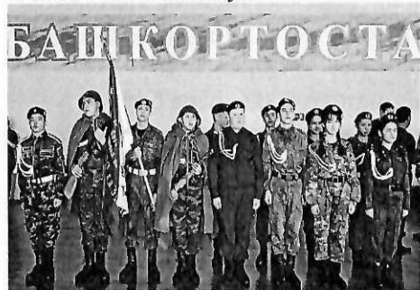
(на фото команда МОБУ СОШ села Ишемгул на “Зарнице”)

“Военно-патриотическое воспитание учеников МОБУ СОШ села Ишемгул”